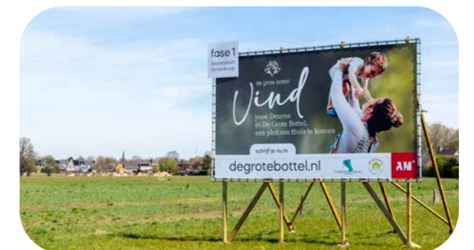
Locatie: De Grote Bottel