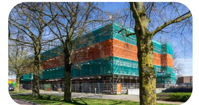
Locatie: Sint Jozef

Aan 't Hofke verdwijnen acht woningen, daar komen er zestien voor terug. Aan de Peelhof maken negen woningen plaats voor twaalf eengezinswoningen én zes levensloopbestendige woningen.